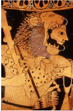
Fig. 8.- Heracles cuyo nombre significa «la preciosa gloria de Hera», hijo de Zeus y Alcmena, y protagonista de los Doce Grandes Trabajos . Ánfora ática, c. 525-500 a.C.

Así, «los Doce Trabajos de Hercacles» se nos revelan como doce trabajos interiores a través de los cuales el hombre desarrolla sus potencialidades más altas, alcanzando la maestría de sí mismo y la unión indisoluble con su propia Alma inmortal.