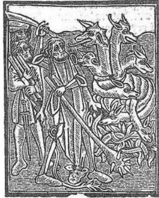
Fig. 10.- Heracles y la hidra de Lerna. 26

Esta hidra también devastaba las cosechas y los ganados del país.