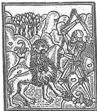
Fig. 9.- Heracles y el león de Nemea. 20

Entonces amenazándolo con la maza, le obligó a entrar en la cueva y obturó una de las entradas. Cogiéndolo luego entre sus brazos, lo ahogó. Muerta ya la fiera, Heracles la despellejó con sus propias garras, pues ni el fuego ni el hierro podían rasgar la piel del león, y se revistió con ella; sirviéndose de la cabeza como casco.